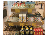
テストマーケティングの様子

有望市場(欧州、オーストラリア)でのテストマーケティング等により、販路拡大や市場への定着を支援します。