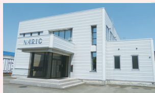
NICOテクノプラザ隣(長岡市)