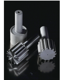
フライスカッター