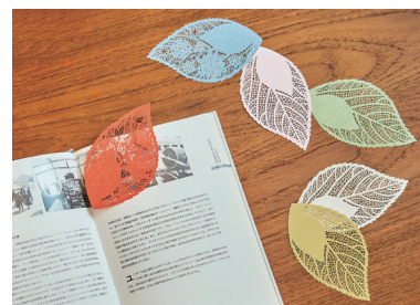
(株)DI palette 紡ぎ業(百年物語)